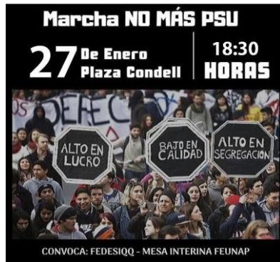
Afiche extraído desde la red social Instagram de la Federación de Estudiantes Secundarios de Iquique (FEDESIQQ)